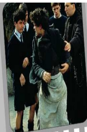
4 Le jeune employé est renvoyé pour avoir fait du marché noir.

Un jour, Julien découvre la vérité: Jean Bonnet s'appelle en réalité Jean Keppelstein et il est juif. Les prêtres l'ont recueilli ° avec deux autres enfants juifs pour le soustraire ° à la police allemande. Au collège, il est en sécurité tant que ° sa véritable identité reste cachée. ° Depuis cette découverte, les relations entre les deux garçons changent et ils deviennent amis.